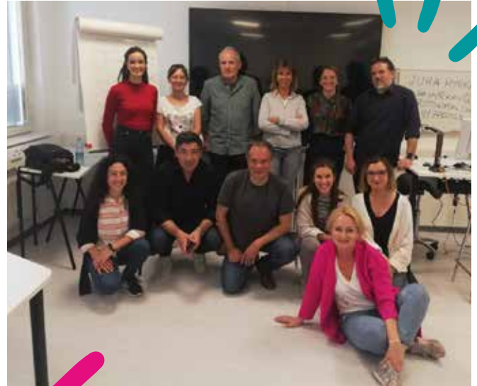
Οι εταίροι του έργου ATL στην 4η Διακρατική Συνάντηση του Έργου στο Ελσίνκι

Οι οργανισμοί-εταίροι συναντήθηκαν στο Ελσίνκι (Φινλανδία) τον Ιούνιο του 2022 για την τέταρτη διακρατική συνάντηση του Έργου, με στόχο να μοιραστούν τα αποτελέσματα της πιλοτικής δοκιμής του εκπαιδευτικού προγράμματος που έχει αναπτυχθεί. Το πρόγραμμα στοχεύει να εκπαιδεύσει επαγγελματίες που εργάζονται με άστεγους στο μοντέλο Υποστηρικτικής Ομοτίμων, παρέχοντάς τους τα απαραίτητα εργαλεία ώστε να εκπαιδεύσουν μελλοντικούς «Πιστοποιημένους Ομότιμους Υποστηρικτές». Πρόκειται για άτομα με βιωμένη εμπειρία έλλειψης στέγης που βρίσκονται σε προχωρημένο στάδιο της διαδικασίας ανάκαμψης και που μπορούν να αξιοποιήσουν αυτήν την εμπειρία τους για να υποστηρίξουν ομότιμούς τους που βρίσκονται σε κατάσταση μεγαλύτερης ευαλωτότητας.