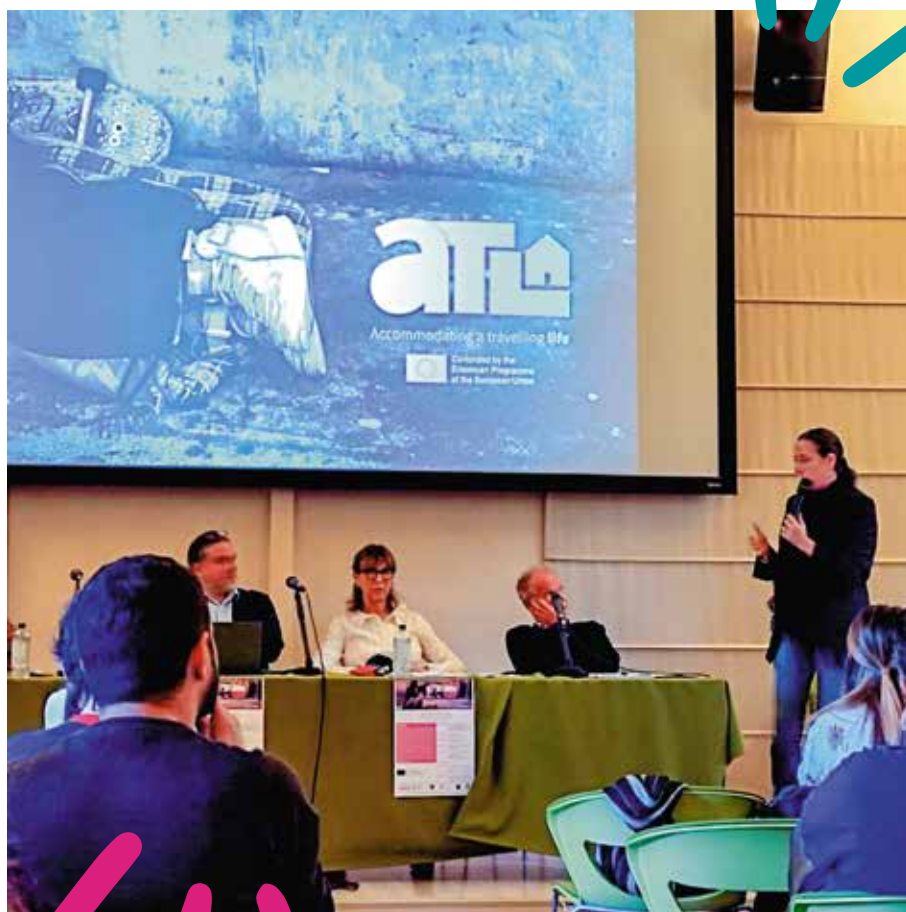
Final International Conference of the ATL project in Florence