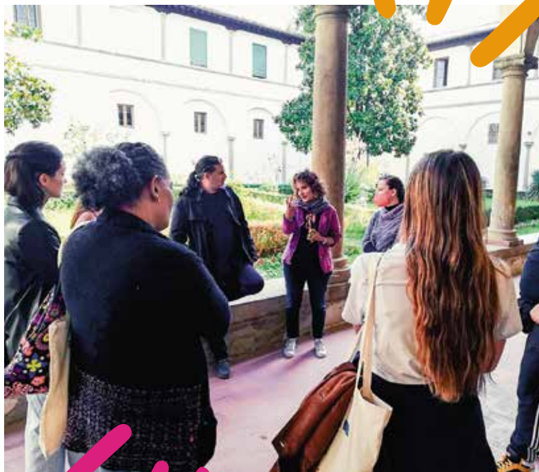
ATL project partners visiting the Albergo Popolare in Florence

Πρώτη στάση: το Κέντρο Ημέρας La Fenice, στο οποίο παρέχεται ολοκληρωμένη υποστήριξη σε άστεγους και άλλα ευάλωτα άτομα που ζουν στη Φλωρεντία, μέσα από σειρά εξειδικευμένων υπηρεσιών που αποσκοπούν στην κάλυψη των διαφορετικών αναγκών των ατόμων που ζητούν υποστήριξη. Τα άτομα αυτά μπορούν να έχουν πρόσβαση στο La Fenice με τρεις διαφορετικούς τρόπους, μέσα από μια «αρχική συνέντευξη» και έκδοση κάρτας πρόσβασης, εγγραφής ή ημερήσιας υποδοχής. Με τον τρόπο αυτόν, αποκτούν πρόσβαση σε υπηρεσίες κάλυψης βασικών τους αναγκών, όπως ντους, πλυντήριο αλλά και ψυχιατρική και ψυχολογική υποστήριξη. Μπορούν επίσης να ξεκινήσουν μια πορεία προς την ανάκαμψη από τις συνθήκες σοβαρής κοινωνικοοικονομικής στέρησης που βιώνουν.